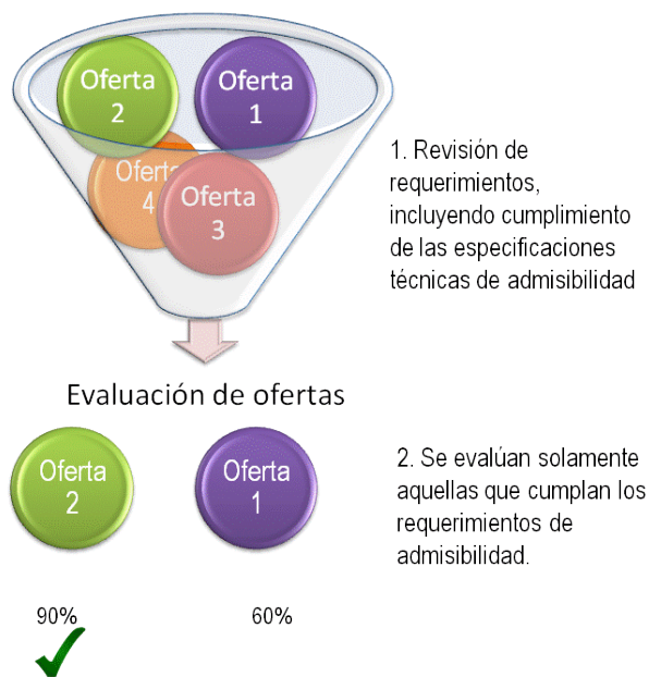
Figura 2. Selección de ofertas

De este modo, según la normativa de cada país lo permita, precio no es el único factor que debería considerarse al evaluar ofertas. En la etapa de evaluación de ofertas existe el potencial para recompensar las ofertas que van más allá de los requisitos mínimos, de modo que la Administración pueda escoger la oferta económicamente más ventajosa, esto es, aquella que “maximiza la satisfacción de los intereses públicos gestionados por la Administración contratante, aquella propuesta contractual que mejor y más eficientemente los sirve, que mayor utilidad reporta al conjunto de todos ellos” (Doménech, 2012).